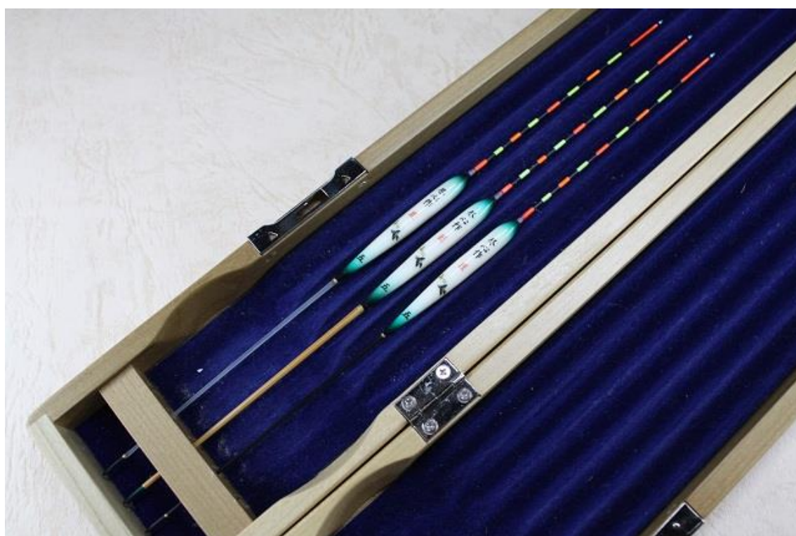
画像1：中央が竹足、右下がカーボン製、左上がガラスソリッド製のウキ